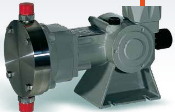
...type SR D