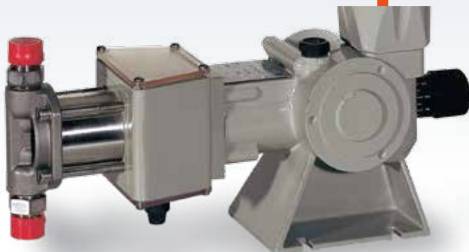
...type SR A